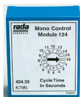
A. Unidad de Control