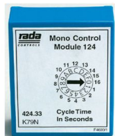
A. Unidad de Control