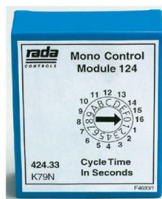
A. Unidad de Control

*Conjunto de sensor, unidad de control individual y electroválvula de sencilla instalación y programación. *Sistema higiénico que no requiere contacto para su activación. *Sistema antivandálico, con componentes fácilmente ocultables y sensores sin tornillos visibles. *Sistema flexible y económico que permite gran ahorro de agua. *Elementos conectados entre sí mediante cables con baja tensión que otorgan gran seguridad a la instalación. *Instalación encastrada en techo. *Base y pantalla del detector en ABS. *Electroválvula de 12 V. 1/2. *Protección IP 55. *Alimentación: 12 V/50Hz. *Cable de 3m de 2 hilos.